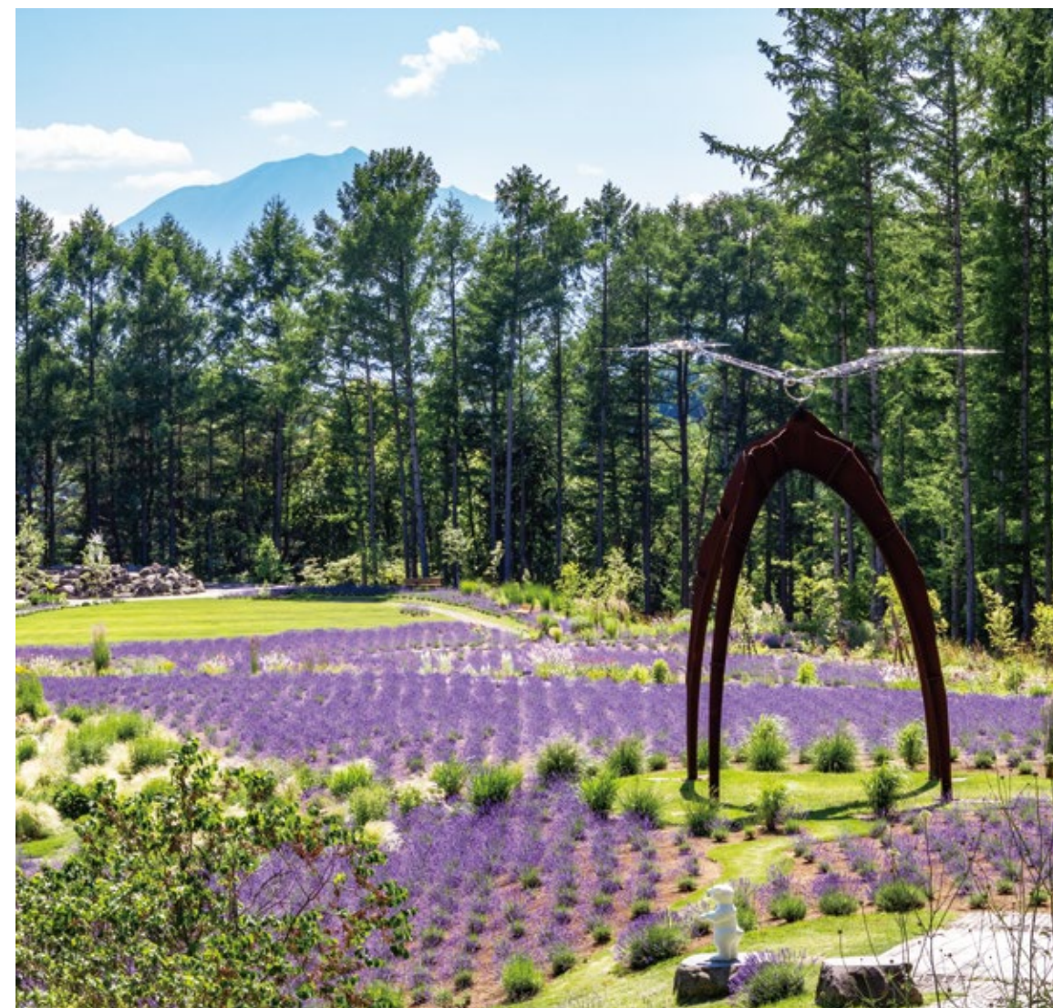
石神の丘美術館 野外展示エリア〈花とアートの森〉 空の広場／ラベンダー園