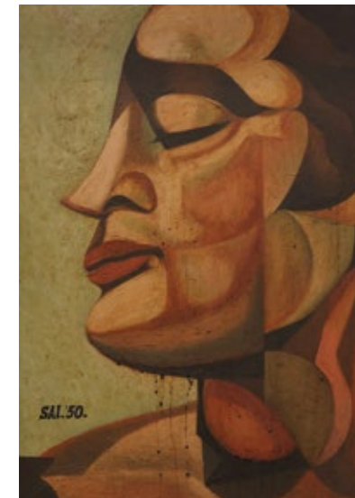
《顔B》 1950年 油彩、キャンバス 91 × 65.5 cm