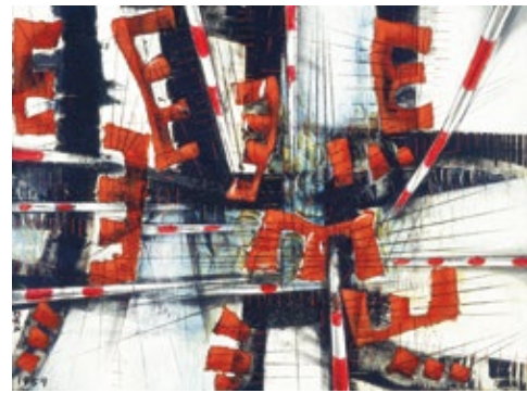
《トポロジー4》 1959年 油彩、画布、布 97×130.3cm