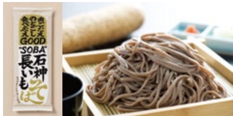
干し麺 200g 324円(税込)

レストラン 石神の丘 10:30-18:00 (L.O.17:30) TEL 0195-61-1602