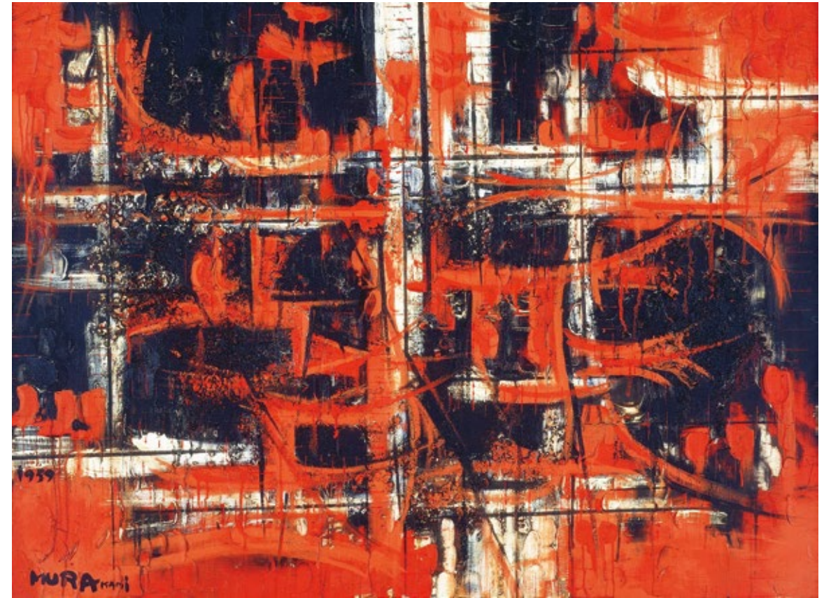
村上善男 《SINGULAR SOLUTION》 1959年 油彩、画布 97×130.3cm

本号では、今年度最初の企画展「没後二〇年 村上善男展」(4月18日~6月7日)についてご紹介しています。本展は当館のシリーズ企画「COLLECTION+ (コレクションプラス)」の一環として開催。今回、当館の「コレクション(収蔵品)」に「+(プラス/加算)」するものとして捉えるのは、2026年2月から7月にかけて、青森県青森市、弘前市、岩手県盛岡市、花巻市、宮城県仙台市、埼玉県さいたま市で開催される、村上善男作品をとりあげる展覧会です。