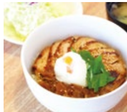
《奥州ハーブ鶏井》 サラダ、みそ汁付 980円(税込)

2月に行われた盛岡広域・道の駅対抗く推し井グランプリ2026にて、レストラン石神の丘の《奥州ハーブ鶏井》が初代グランプリに輝きました。大好評につき延長販売中です。ぜひご賞味ください。