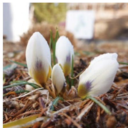
クロッカス (アヤメ科) 寒さに強く、針状の葉の中心に薄紫、白、黄色の花を咲かせます。見ごろは3月中旬から。