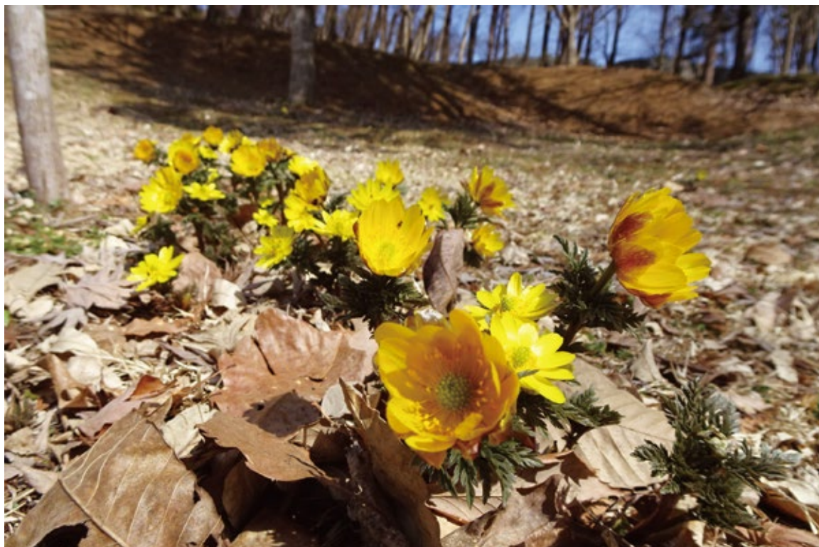
フクジュソウ (福寿草/キンポウゲ科) 寒さ残る3月上旬の〈花とアートの森〉に春を告げる花。黄金色の花びらは太陽の光によってあたためられ、暖を求めて花の内部へ入ってきた昆虫たちによって花粉が運ばれていきます。