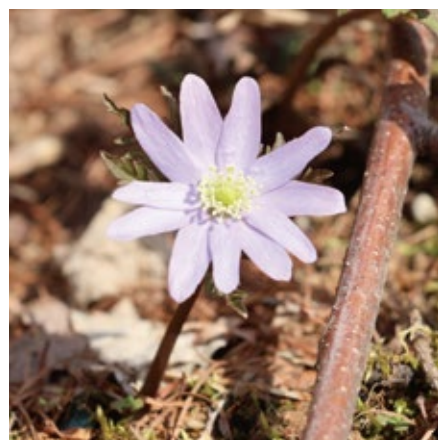
キクザキイチゲ (菊咲一華/キンポウゲ科) よく似た花にアズマイチゲがあります。紫や白の花のように見える部分は実はガク片です。