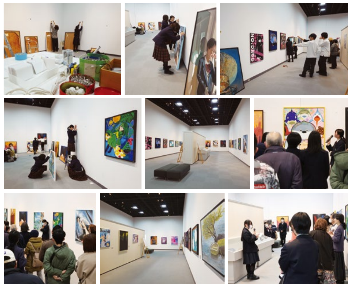
昨年の展示作業と作品解説会の様子。本展では生徒自らが作品の展示順を決め、釘・金づち・水平器などを使って展示します。