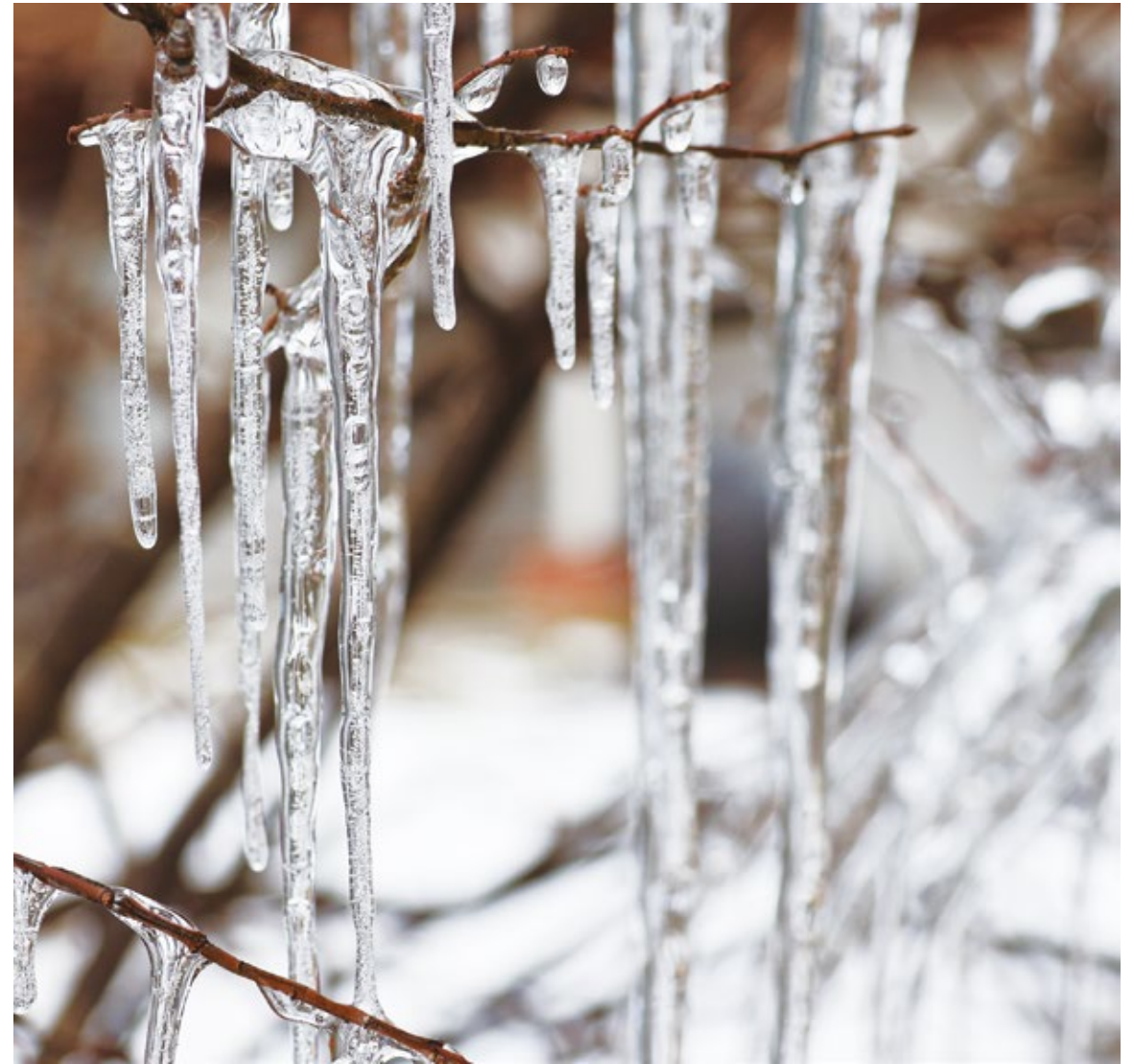
美術館前の樹木にできたツララ