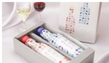
ブルーベリー・リンゴワイン2本セット 3,154円(税込)

レストラン 石神の丘 10:30-18:00 (L.O.17:30) TEL 0195-61-1602