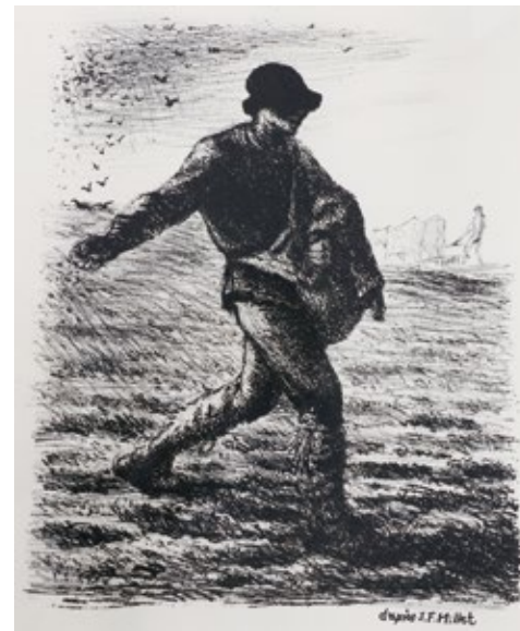
ジャン=フランソワ・ミレー 《種をまく人》 銅版画