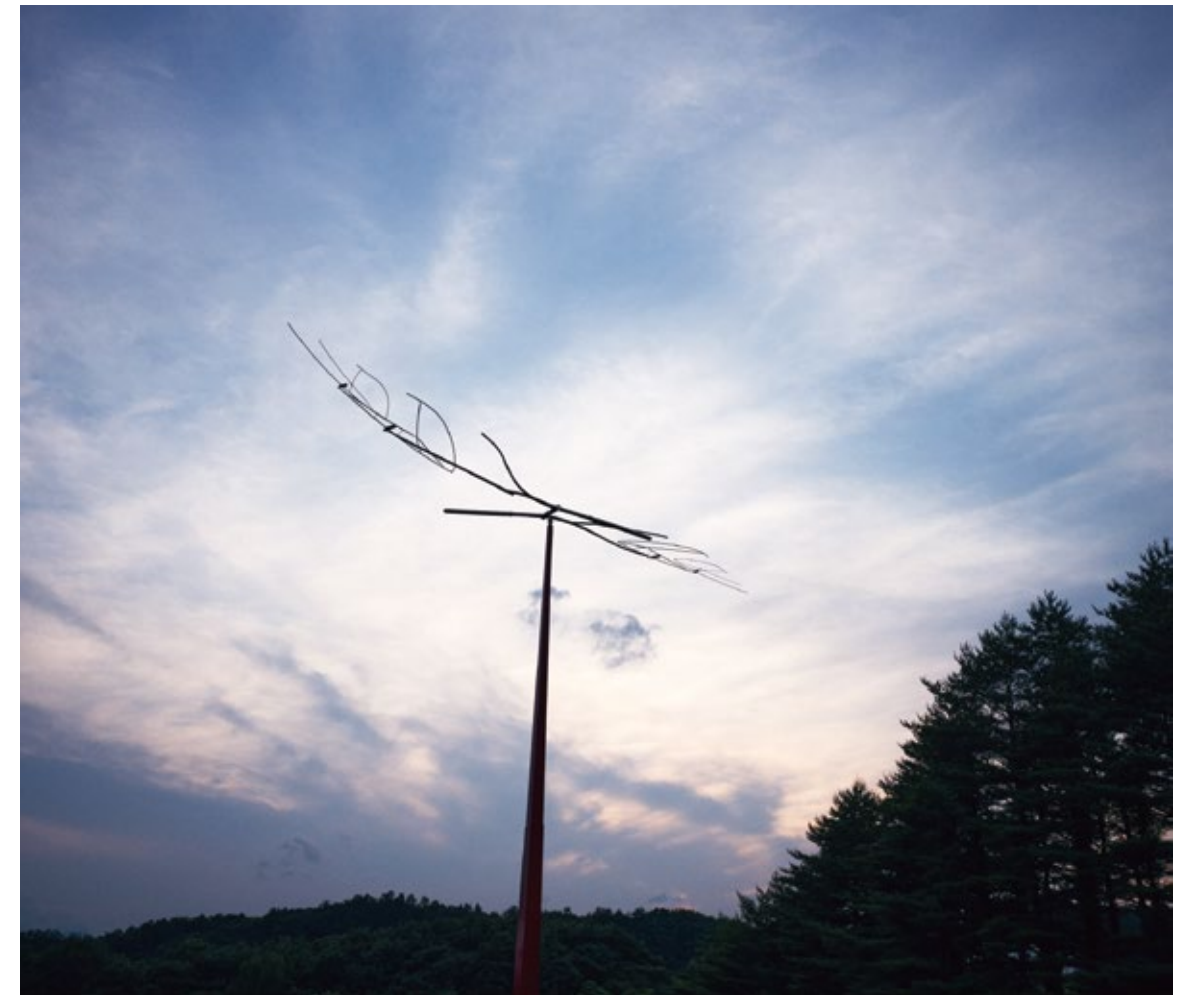
西野康造 《Swing in the Air 2020》(部分)