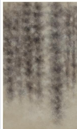
たんのそのこ 《立像》