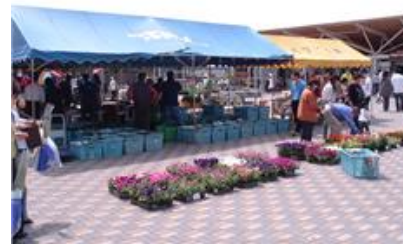
過去の産直まつりの様子