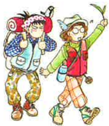
「とりばん」 ©とりのなん子/講談社