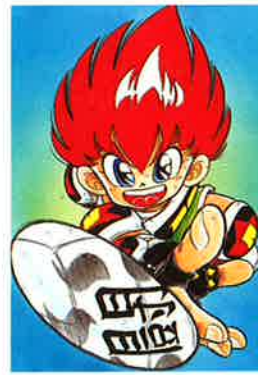
「炎の闘球児 ドッジ弾平」 ©こしたてつひろ(小学館刊)