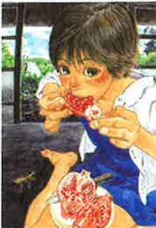
「リトル・フォレスト」 ©五十嵐大介/講談社