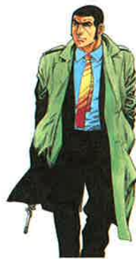
「ゴルゴ13」さいとう・たかを ©SAITO PRODUCTION (小学館刊)