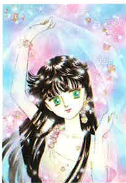
「ときめきトゥナイト」 ©池野恋/集英社