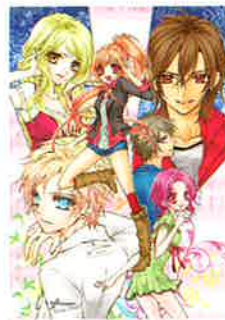
「フライハイ!」 ©小椋池なつみ/集英社