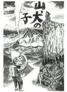
「山犬の子」 ©菅野修(北冬書房刊)