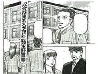
「ドラゴン桜」©三田紀房/講談社