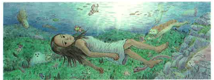
「続・ミヨリの森の四季」©小田ひで次(秋田書店刊)

岩手日報社 河北新報社盛岡総局 岩手日日新聞社 盛岡タイムス社 朝日新聞盛岡総局 毎日新聞盛岡支局 読売新聞盛岡支局 日本経済新聞社盛岡支局 産経新聞盛岡支局 IBC岩手放送 テレビ岩手 NHK盛岡放送局 めんこいテレビ 岩手朝日テレビ エフエム岩手 ラヂオもりおか 奥州エフエム放送 花巻ケーブルテレビ