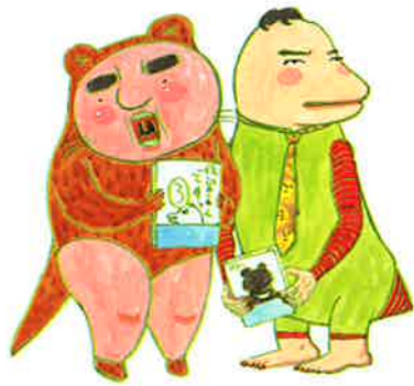
「かわうそと山崎先生」 ©吉田戦車(小学館刊)