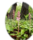
ペニバナイチヤクソウ