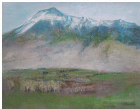
《岩手山麓》 2014年 油彩・キャンバス