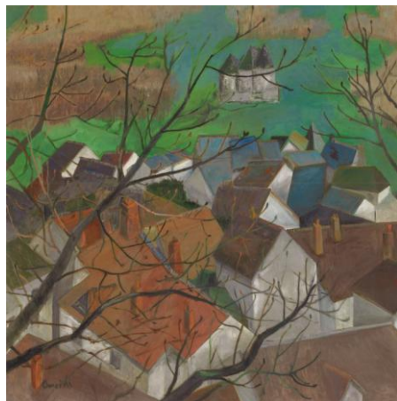
《クリッセ村のクルミの木》 2014年 油彩・キャンバス