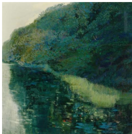
《緑影》 1994年 油彩・キャンバス 盛岡市蔵