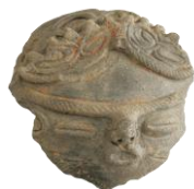
《土面》 (どじの沢遺跡出土)

主催:岩手町教育委員会事務局 社会教育係 TEL.0195-62-2111(内線343)