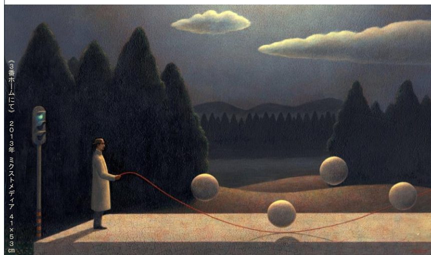
《ホームに》 2013年 ミクストメディア 41×53 cm