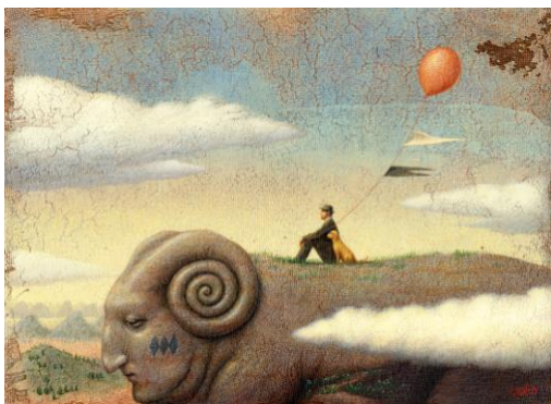
左《誕生》2006年 ミクストメディア 41×31.8cm 個人蔵

今回の展覧会では、個人コレクターの協力を得て、タブローだけでなく立体作品、ドローイングも含め初期の作品から最近作までを展覧します。