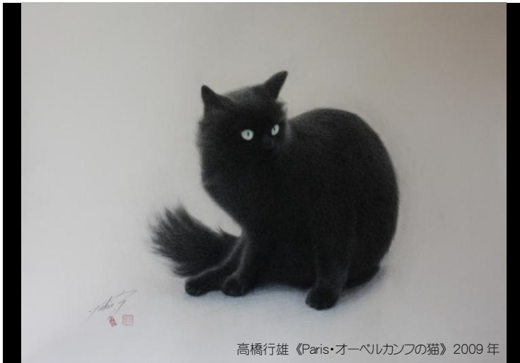
高橋行雄 《Paris・オーベルカンフの猫》2009年